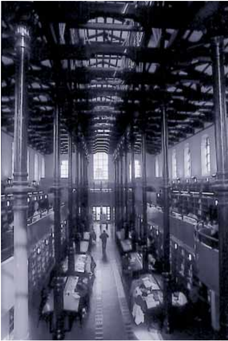
Zaragoza es líder en número de bibliotecas por habitante

Como Sociedad del conocimiento Zaragoza se sitúa en el cuarto puesto, por detrás de Barcelona, Bilbao y Madrid. Y esta posición intermedia es debida a que la cultura humanística es positiva en la ciudad, si se mide el gasto en viajes y turismo, mientras que la cultura tecnológica y la ciencia y tecnología presentan niveles inferiores, al registrar datos negativos como el de ser la última urbe en gasto en investigación y desarrollo y contar con el menor porcentaje de usuarios de ordenadores personales.