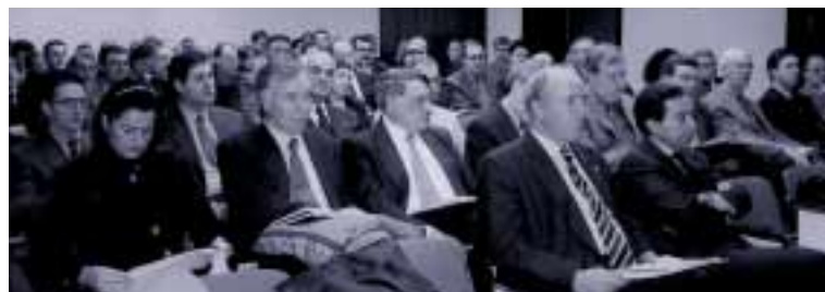
Un centenar de personas siguió atentamente el foro de debate