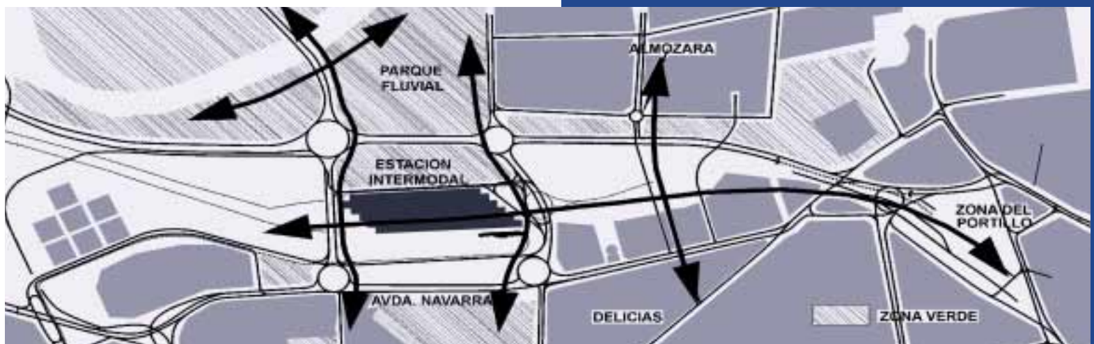
Esquema urbanístico de la Avda. de Navarra

Toda esta pieza urbana se sitúa formando un corredor dispuesto radicalmente hacia el Centro Histórico que enlaza el segundo, tercer y cuarto cinturón y que forma parte de un arco que recorre la mitad Oeste de la ciudad, donde se concentran otras áreas significativas de actividad: el eje cívico del Actur, los campus universitarios, la gran zona de equipamientos del ensanche etc.