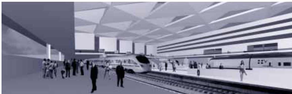
Recreación del proyecto seleccionado. Interior