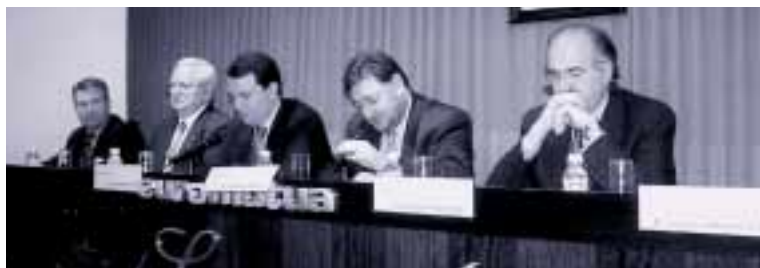
Imagen de la inauguración de la jornada

Asimismo, consideró “imprescindible” la actuación conjunta del sector público y privado en el campo de proyectos estratégicos. La participación responsable de todos los agentes implicados; el compartir riesgos y beneficios; la compatibilidad con las ayudas comunitarias; la minimización de los fondos presupuestarios y el control y supervisión del servicio por parte de la administración pública son sus principales ventajas.