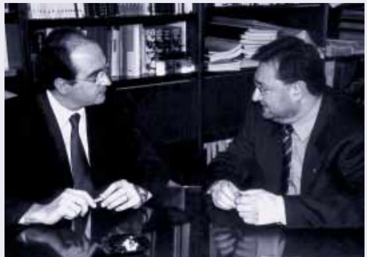
Firma de los convenios de colaboración con Radio Zaragoza y Antena Aragón