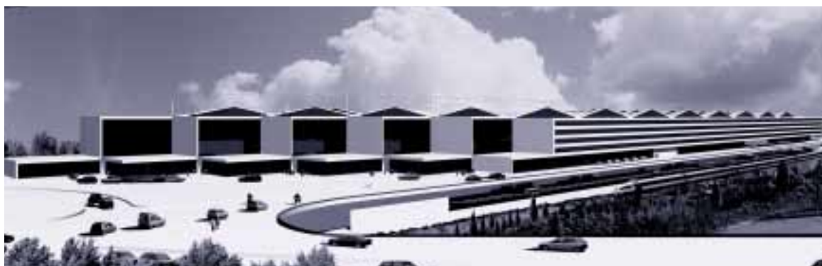
Recreación del proyecto seleccionado. Exterior

“Se trata de un complejo emblemático, funcional y contemporáneo. La solución planteada acentúa el lugar a través de una espectacularidad elegante, cumple los requisitos funcionales y al mismo tiempo tiene la capacidad de