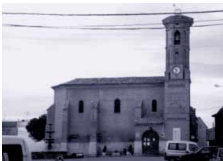
Iglesia parroquial de Pinseque

La actualidad está marcada por el constante crecimiento de Pinseque, debido a la instalación dentro de su término municipal de un campo de golf y diversas urbanizaciones residenciales, que poco a poco están cambiando la configuración del entorno.