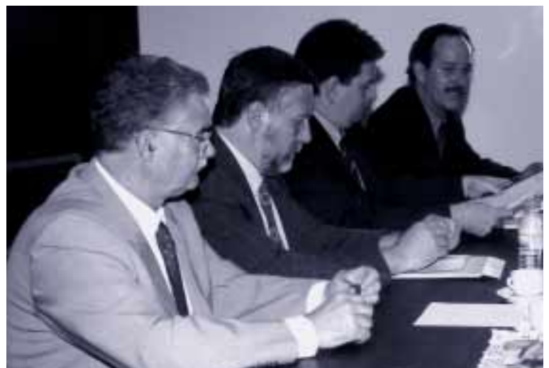
Reunión de la Ejecutiva con Spainzaz

Las CIEP están ya analizando la información que se está recogiendo con el fin de poder elaborar un informe sobre el grado de ejecución de las acciones propuestas.