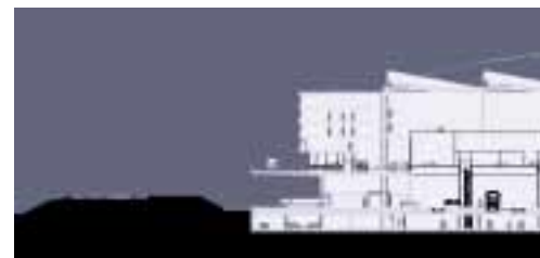
Sección transversal de la estación

En la primera, –en que se presentaron 18 equipos– fueron seleccionados 7 para pasar a la siguiente fase, primando tanto