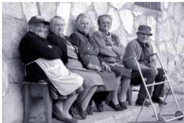
La atención a los ancianos genera cada día más empleo