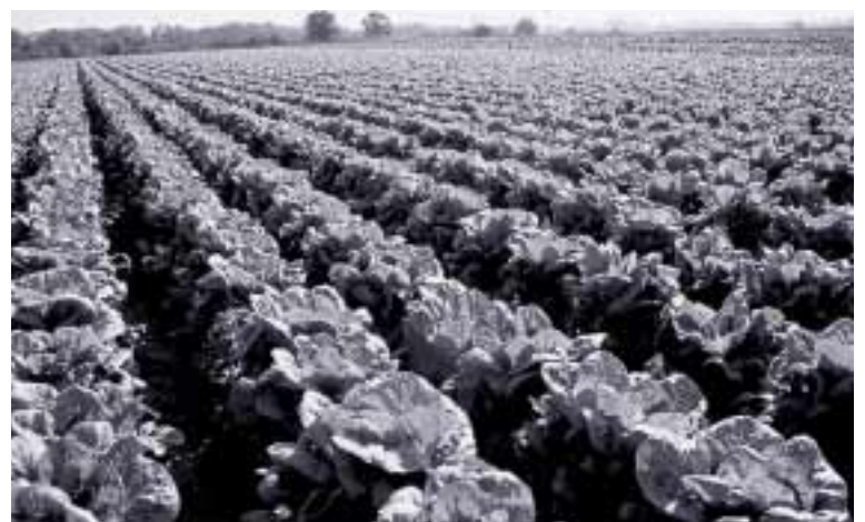
Objetivo: conseguir que la huerta sea un espacio de equilibrio, integración y fuente de recursos para una alimentación sana y natural