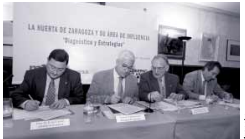
El alcalde de Zaragoza y presidente de EBRÓPOLIS y el consejero de Agricultura firmaron la carta de adhesión a la huerta junto a los ediles de los municipios del entorno

El pasado 14 de marzo se presentaron a la sociedad las conclusiones de la Mesa de la Huerta y sus propuestas de futuro. El acto, celebrado en Mercazaragoza, estuvo presidido por el alcal-