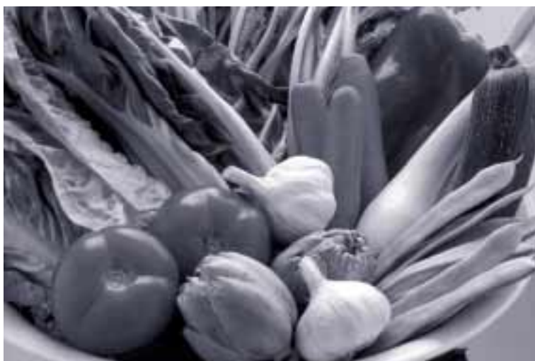
Los consumidores aprecian la calidad de los productos hortofrutícolas zaragozanos