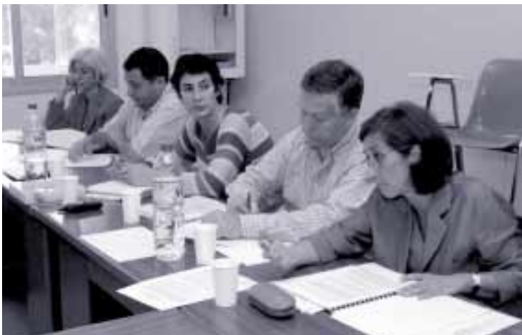
La CIEP 3 conoció el informe sobre la vivienda elaborado por El Justicia de Aragón

Recientemente, el pasado seis de mayo, se constituyó una Mesa de trabajo sobre las nuevas tecnologías y la sociedad del conocimiento , con el propósito de poner en marcha las siguientes acciones previstas en el Plan Estratégico: Impulsar la incorporación de las nuevas tecnologías a la sociedad en general y a los recursos humanos en particular y potenciar la Universidad como punto entre el conocimiento y