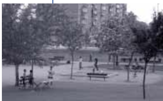
Los vecinos del barrio disfrutan de su parque

alrededor de 4.000 personas –un 35% de la población del barrio– han intervenido en las 450 actividades desarrolladas en él. Además, el parque Oliver cuenta con un jardín de plantas esteparias con 35 variedades diferentes, el único de estas características existente en Zaragoza.