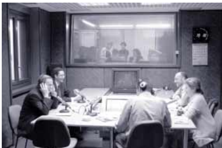
Programa en Radio Zaragoza sobre los Nuevos Yacimientos de Empleo

EBRÓPOLIS ha tenido muy en cuenta a este sector y su repercusión en la sociedad a todos los niveles. Dentro de la Línea Estratégica 3 , la que trata de que Zaragoza sea una “ciudad creativa en el arte, el humanismo y la comunicación” , se recoge un objetivo con el