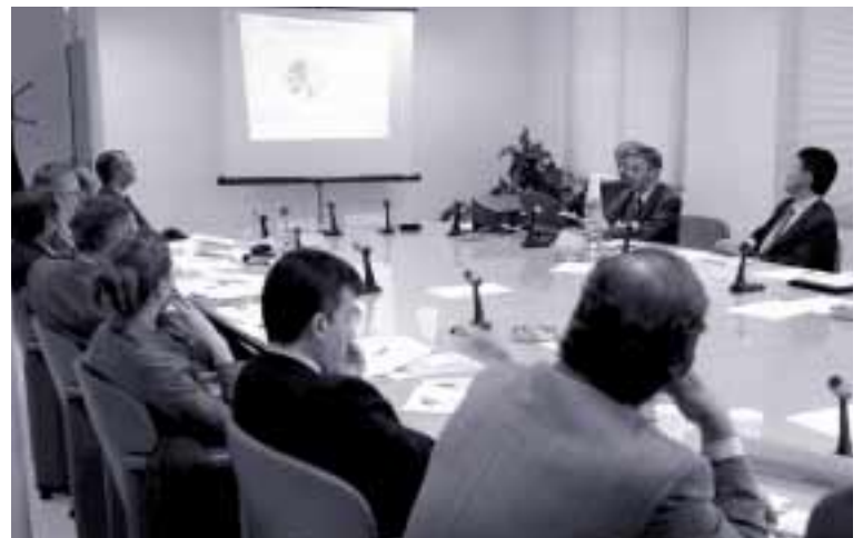
En mayo, se constituyó la Mesa sobre las tecnologías y la sociedad del conocimiento