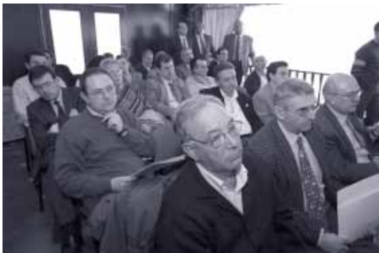
Un centenar de personas asistieron a la presentación de la huerta en Mercazaragoza

Por su parte, Arguilé corroboró el respaldo del Gobierno de Aragón para aprovechar el potencial de la huerta. “No hay que olvidar que en la comarca de Zaragoza hay instaladas 47 empresas agroalimentarias, más de 12 cooperativas, hay pueblos que aún tienen mucha actividad agraria y, por lo tanto, es una comarca importantísima desde el punto de vista de la economía agraria”, explicó.