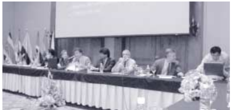
Un momento de la celebración de la reunión del CIDEU celebrada en Quito

Otros factores determinantes en la planificación estratégica serán, según Asín, la definición concreta de las acciones a implantar y la delimitación de las entidades competentes, sin olvidar la importancia de la participación ciudadana a todos los niveles.