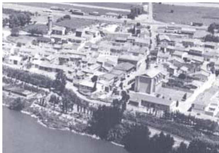
Vista aérea de Osera de Ebro

Pero la localidad de Osera también tiene espacios para el recreo y el esparcimiento de