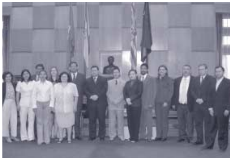
Inauguración del VI Curso de Gestores Iberoamericanos en el Ayuntamiento de Zaragoza

La realización de estos cursos permite el intercambio de ideas, proyectos y experiencias entre responsables locales de ciudades iberoamericanas que buscan referencias para su desarrollo. Esta formación es una de las actividades que desarrolla EBRÓPOLIS siguiendo su Objetivo General de que Zaragoza se convierta en puente hacia Hispanoamérica potenciando los lazos históricos y culturales que nos unen hacia el continente.