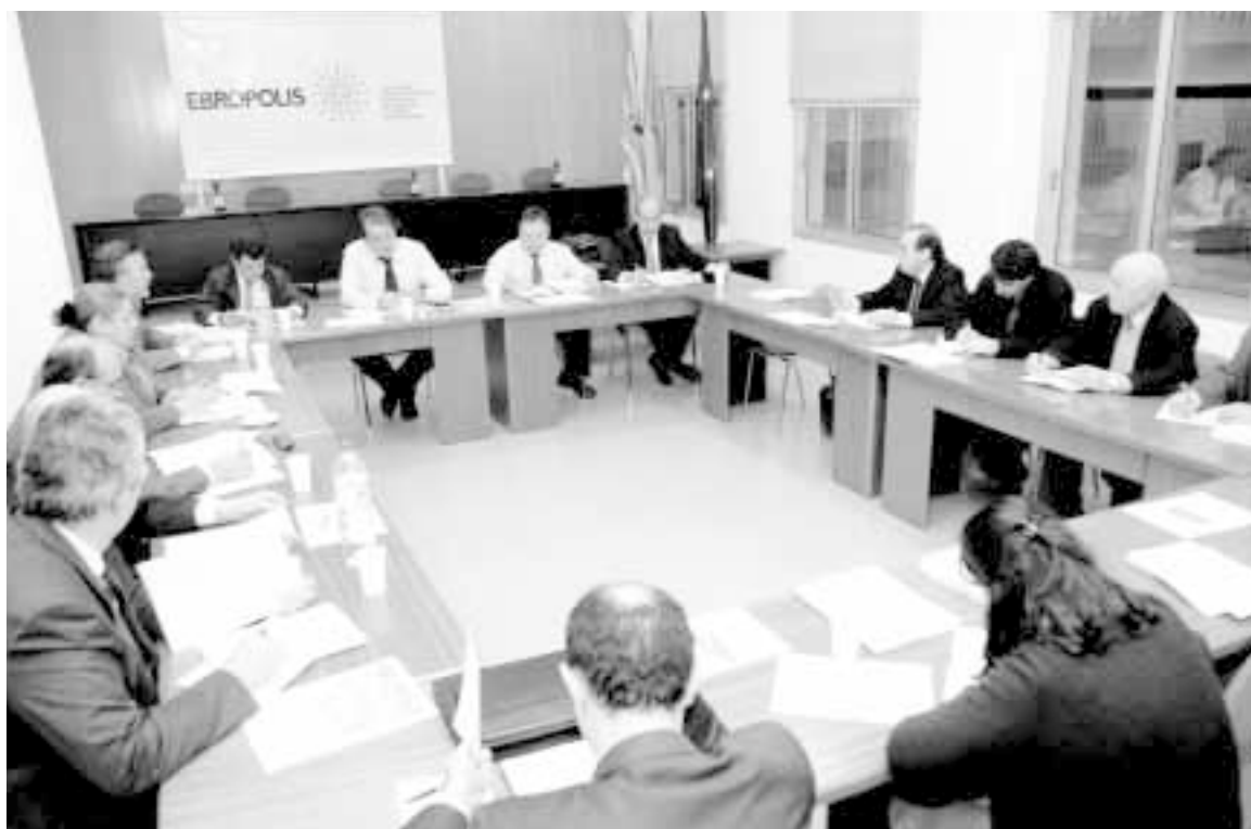
La Ejecutiva respalda el método de revisión del Plan Estratégico

Con todo ello se pretende conseguir una valiosa documentación que servirá de base para que, ya en el otoño, los grupos de trabajo realicen la revisión de las líneas estratégicas y de las 140 acciones del Plan, con el objetivo de reorientar aquellas ya superadas por las circunstancias, cerrar las ya conseguidas y proponer todas aquellas actuaciones que por su carácter novedoso o estratégico se consideren de