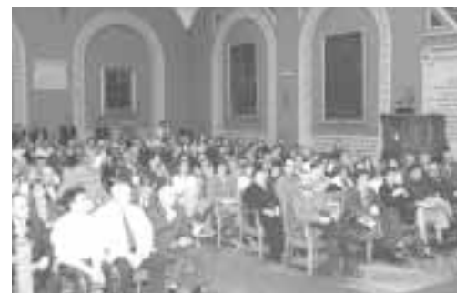
El Paraninfo se llenó para conocer al ganador de la segunda edición