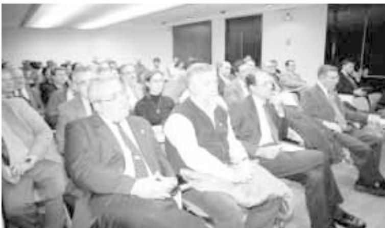
Las CIEP participarán en la actualización del Plan