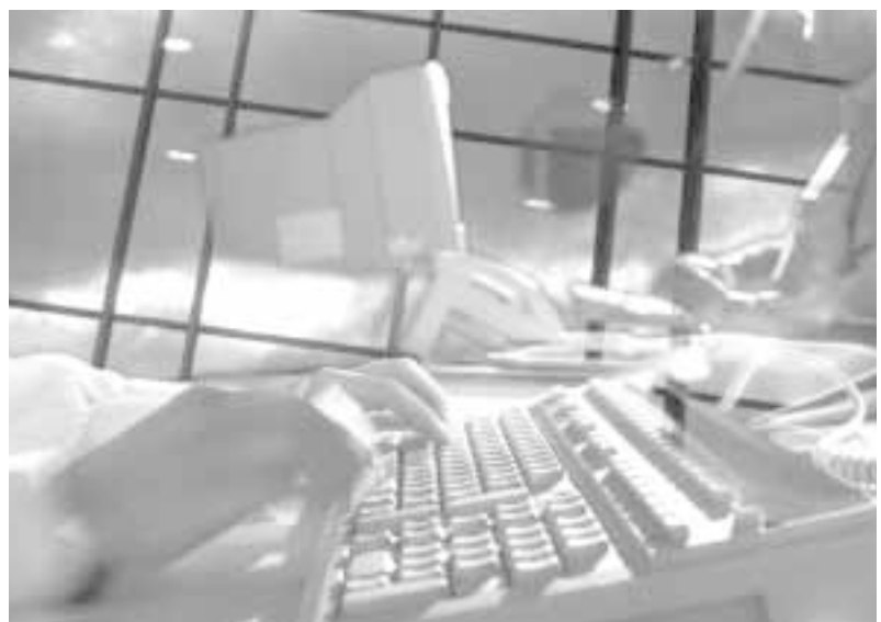
Las nuevas tecnologías son un sector estratégico para el desarrollo futuro

Estos bloques temáticos estarán acompañados por un análisis externo, que permitirá obtener una visión general de la posición de Zaragoza y su entorno ante el reto de la globalización y en la red de ciudades europeas.