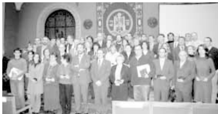
Los candidatos al 2º Premio, al finalizar el acto de entrega

Campañas de información y sensibilización social sobre la donación de órganos en Zaragoza y provincia (ALCER Ebro).