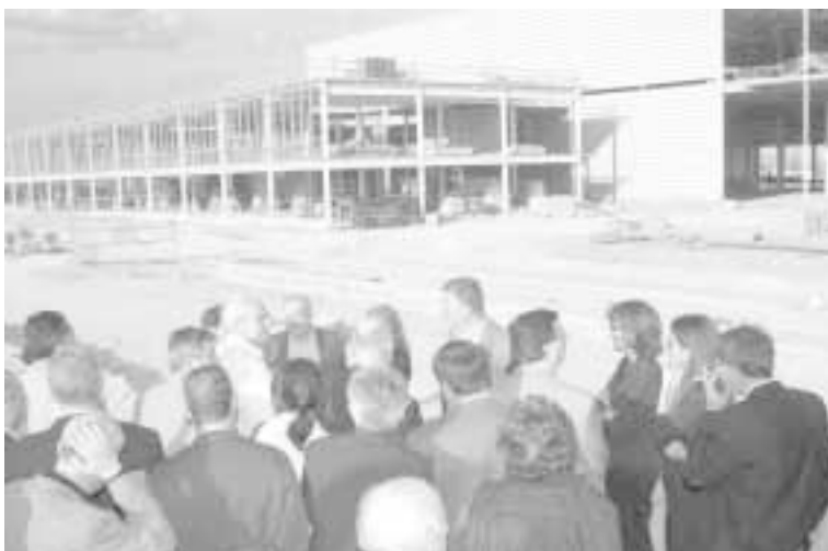
PLA-ZA ya deja notar su influencia en el entorno zaragozano