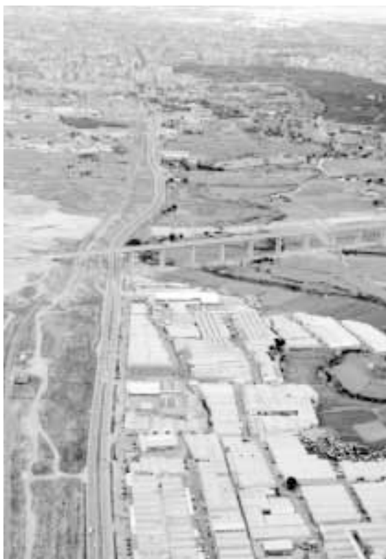
La cercanía a Zaragoza es para Cuarte un factor clave de desarrollo industrial