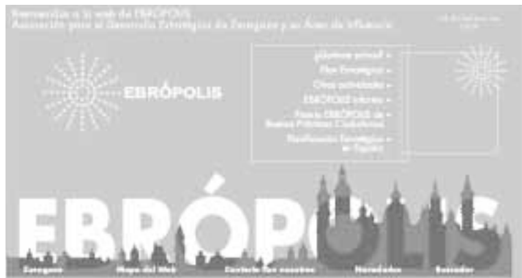
La web ofrece también detallada información sobre Zaragoza y su entorno

Asimismo, existe otro dato que revela que la información ofrecida por el sitio web de la Asociación tiene interés para los internautas. En todo el año 2003, las personas que visitaron la web de la Asociación hicieron enlaces, en un total de 9.735 ocasiones, con alguna de las páginas que se ofrecen en www.ebropolis.es . Estas páginas son, fundamentalmente, las de los socios de EBRÓPOLIS y también de cuestiones relacionadas con las acciones estratégicas.