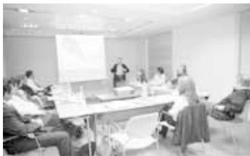
Los dirigentes iberoamericanos conocieron la candidatura de Zaragoza para la Expo 2008

En Zaragoza se dieron cita altos directivos municipales de las ciudades de Querétaro (México), Córdoba (Argentina), Villa El Salvador y Bellavista (Perú) y Cuenca (Ecuador), que actuó de coordinadora, además de un delegado de la Federación Mundial de Ciudades Unidas.